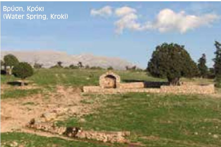
Βρύση, Κρόκι (Water Spring, Kroki)

The "Skala" is in front of us for some smooth and nice zig zaged climbing over the City of Delphi that will lead us straight to the summer camp settlement of "Kroki" with the traditional drinking water fountain that will quench our thirst and supply us with fresh water once more. After the brake we follow the E4 sign to the north and into the National Forest of Parnassos Mt. The course, apart from the E4 signs, is also "assisted" by the water pipeline that runs through the pathway. On our climb we will meet the rural road several times until we finally reach the fantastic "Kalania" plateau where the